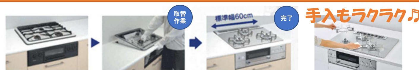
既設コンロ(標準幅60cmタイプ)

ビルトインコンロは外してはめ込むだけ! 75cmタイプもあります。 バーナーの間隔が広くなり、大きな鍋が左右に置けます。